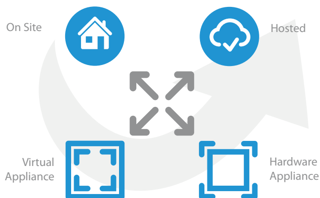
Diverse Möglichkeiten, Cryptshare zu betreiben.

Es ist nicht erforderlich, zusätzliches Personal für den Betrieb der Lösung aufzubauen.